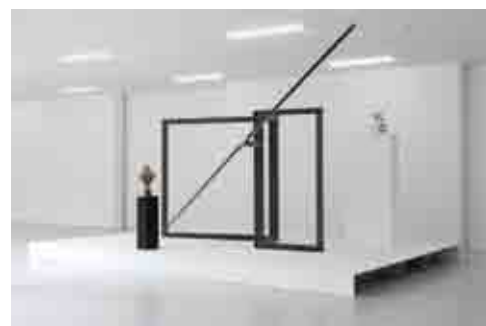
Carol Bove / Carlo Scarpa, installatiezicht Museum Dhondt-Dhaenens, 2015

Als case study richtte Carol Bove zich op de expo 'Ambiente', Scarpa's bijdrage voor de 34ste Biënnale van Venetië in 1968, waarbij de archi-