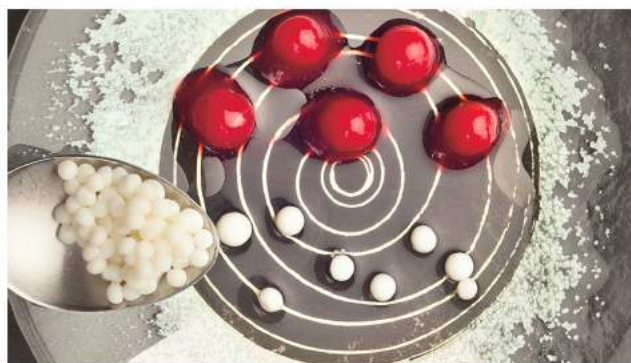
5. Still van een gerecht uit de film 1846, 2013