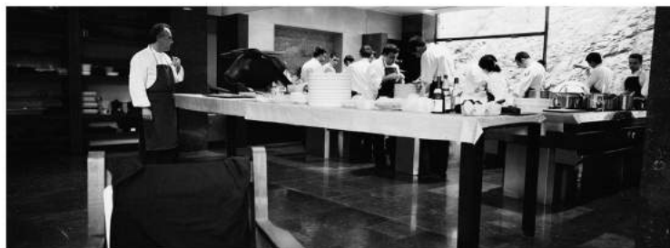
2. Interieur van elBulli Keuken, 2005-2011