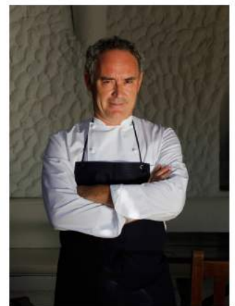
6. Ferran Adrià