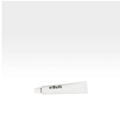
7. elBulli tube