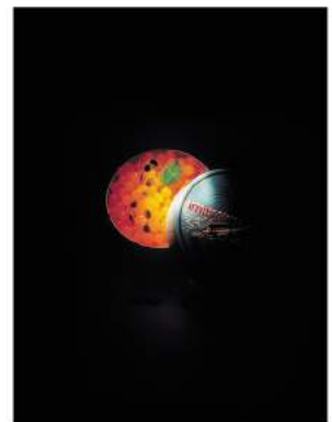
9. Olijfolie kaviaar Met dank aan elBullifoundation