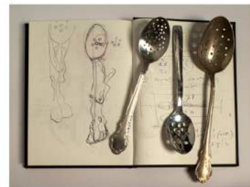
3. Zeeffepel, 2003 Ontwerp: Luki Huber Notitieboek en lepel prototypes Met dank aan elBullifoundation