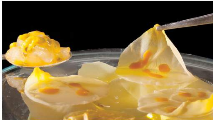
8. Still van een gerecht uit de film 1846, 2013