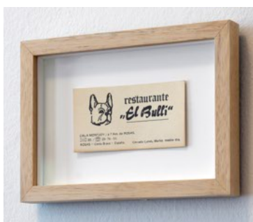
De kookkunsten van Ferran Adrià: intrigerende combinatie van wetenschap, gastronomie en een vleug kunst.